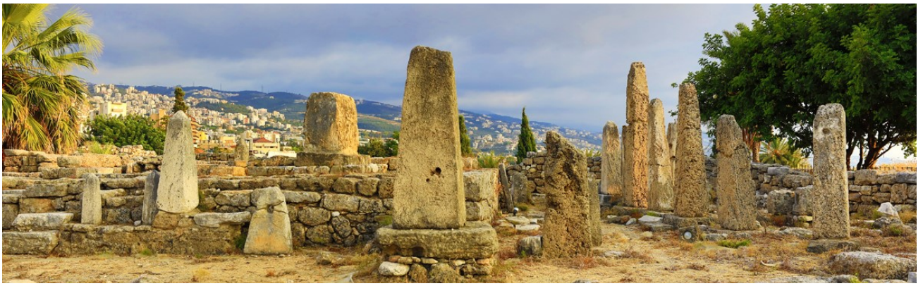
比布魯斯的方尖碑神廟

比布魯斯城堡，羅馬港口，劇場，墓園，市場，比布魯斯遺址博物館Byblos Site Museum，聖約翰馬克大教堂St. John-Marc Cathedral。機場回香港。