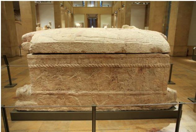
貝魯特國家博物館

貝魯特國家博物館 National Museum of Beirut，貝魯特美國大學考古博物館 Archaeological Museum of the American University of Beirut，聖佐治希臘東正教大教堂 Greek Orthodox Cathedral of Saint George & Crypt Museum，礦石博物館 MIM Museum。